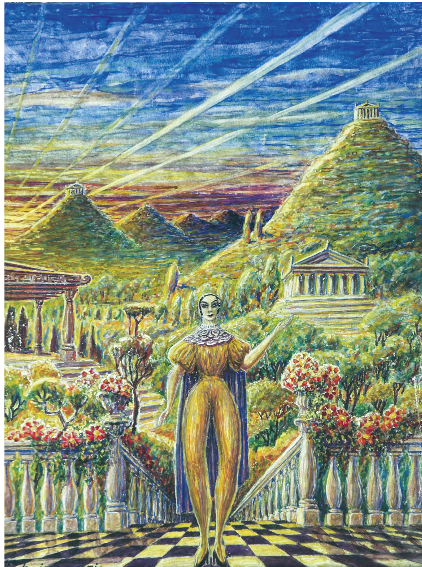
Ovartaci . 31 x 24, 5 cm, u.å. Operasanger med lange ben og en smal talje iført højhælede sko i et landskab, der minder om det antikke Grækenland. lede sko i et landskab, der minder om det antikke Grækenland.