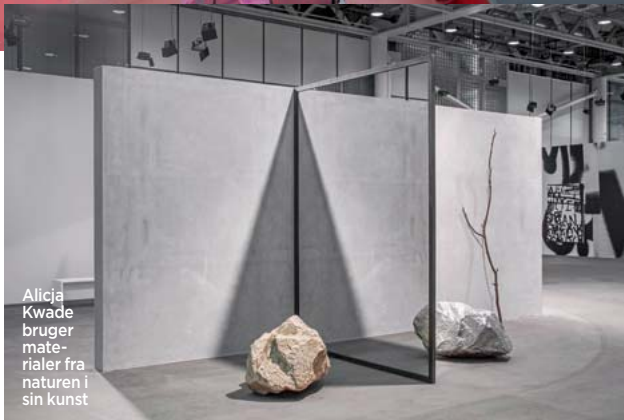
Alicja Kwade bruger materialer fra naturen i sin kunst