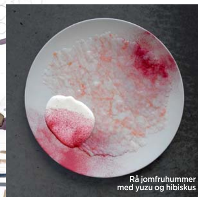
Rå jomfruummer med yuzu og hibiskus