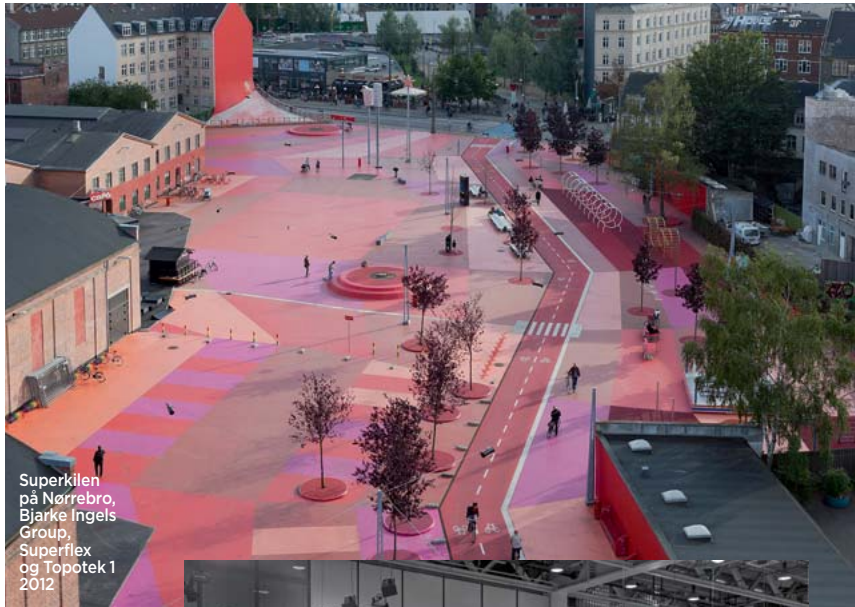
Superkilen på Nørrebro, Bjarke Ingels Group, Superflex og Topotek 1 2012