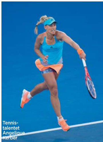
Tennis-talentet Angelique Kerber