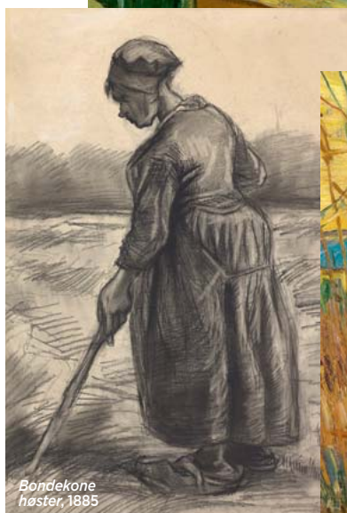
Bondekone høster, 1885