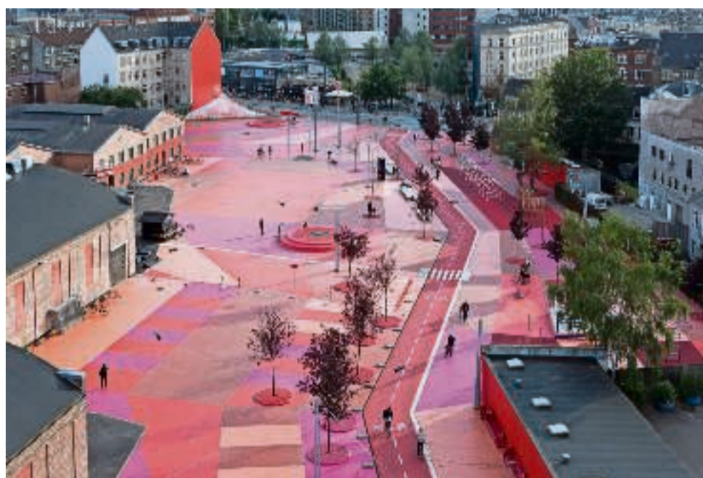
Superkilen/SUPEREFLEX Foto: BIG

realisere i virkeligheden. Men også et eventyr.«