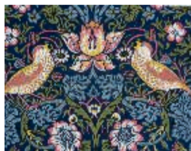
William Morris.

Nivågaard åbner 13. februar dørene til den første store udstilling på dansk grund med den engelske kunstner William Morris, der særligt er kendt for sine mønstrede tekstiler og farverige tapeter og som en af hovedfigurerne i Arts & Crafts-bevægelsen. Men William Morris var også både