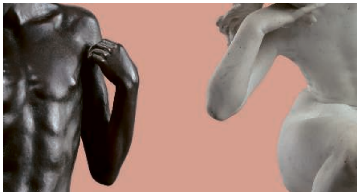
Perfect Poses.