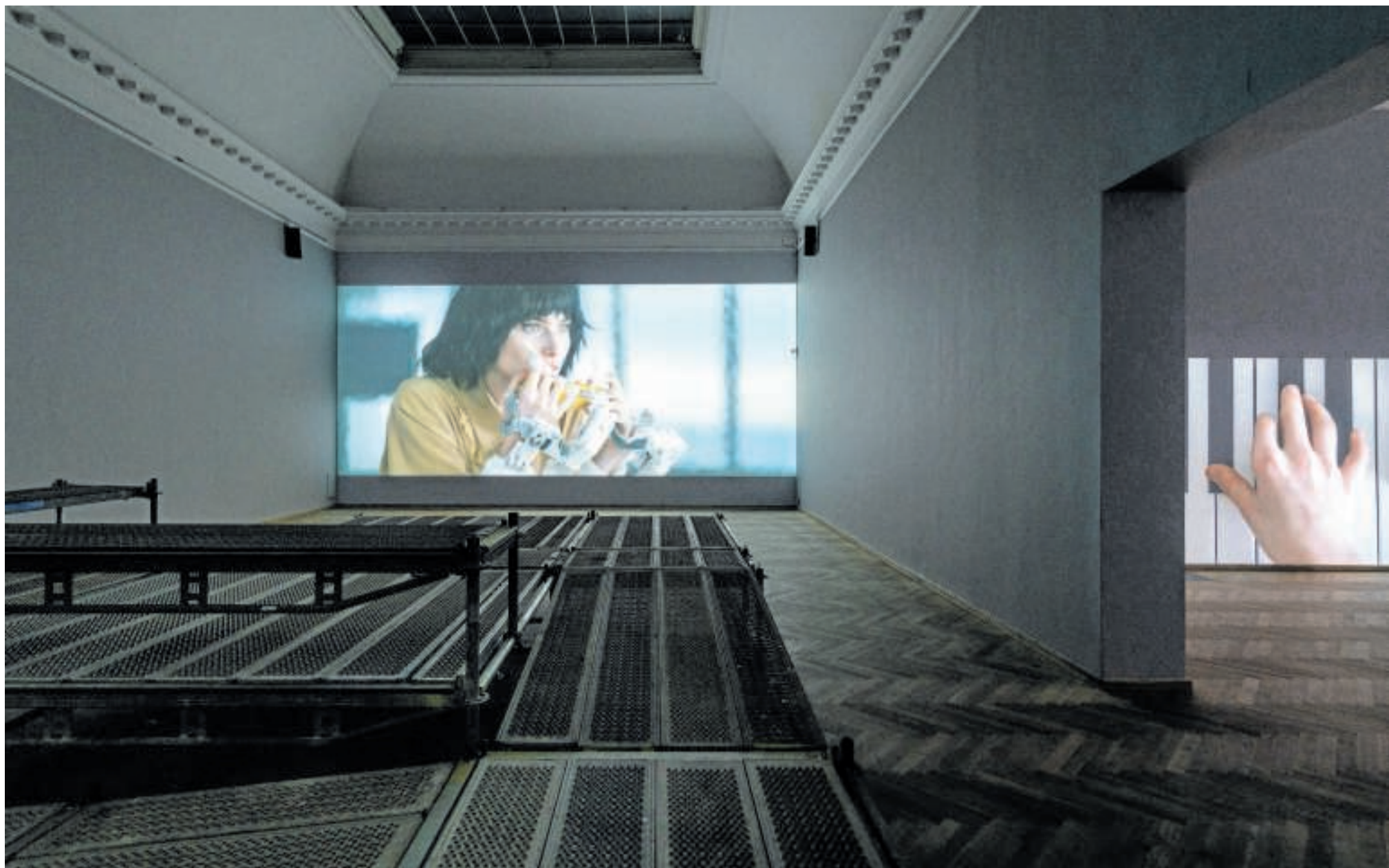
▲ Den nok mest kendte scene fra værket "Servitutes" er videoen, hvori en mørkhåret kvinde (spillet af den amerikanske model og skuespiller Dree Hemingway iført sort paryk) spiser en majscolbe med en form for robotarme, et rehabiliteringsudstyr til genoptræning af musklerne i hænderne.