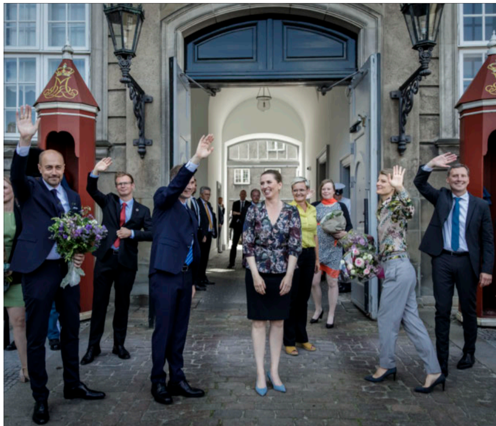
Mette Frederiksen – danskerne skal overvåges, men ikke regeringen.