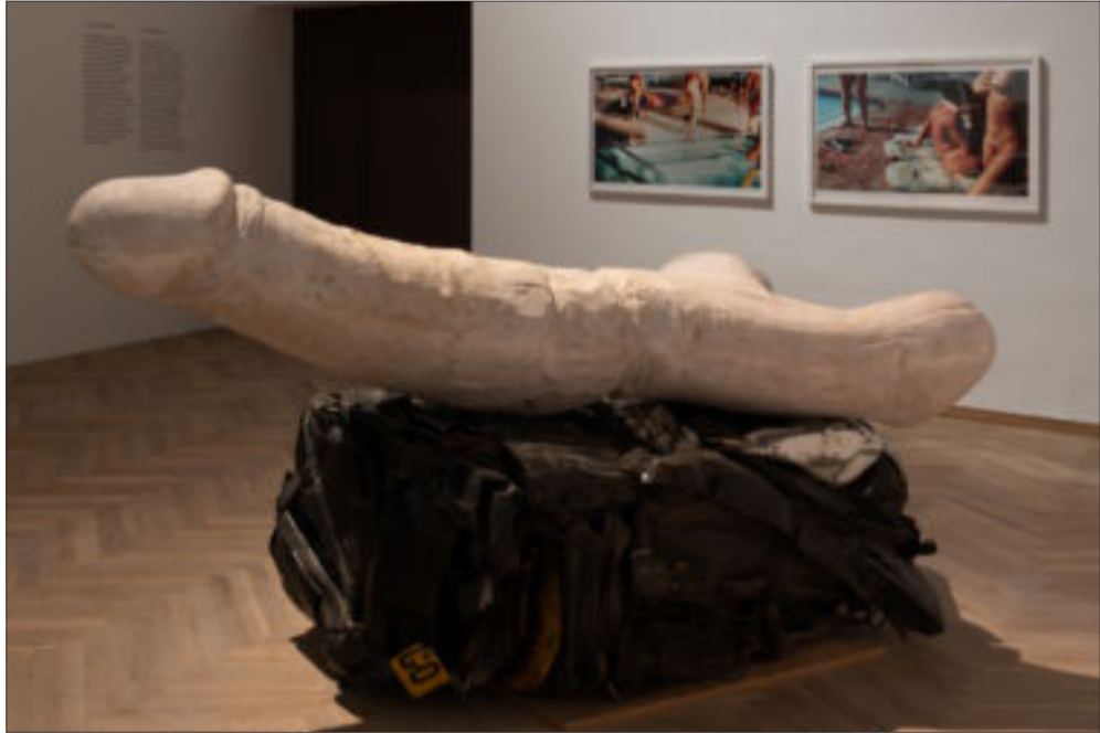
Porno-udstillingen på Kunsthal Charlottenborg byder bl.a. på dette værk.