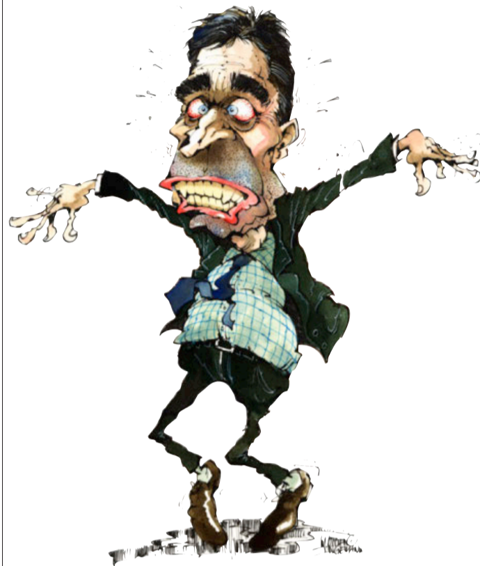
Den forhenværende Anders Fogh Rasmussen har igen tabt sutten.

Den forhenværende Anders Fogh Rasmussen forsøger at kloge sig i Jyllands-Posten: