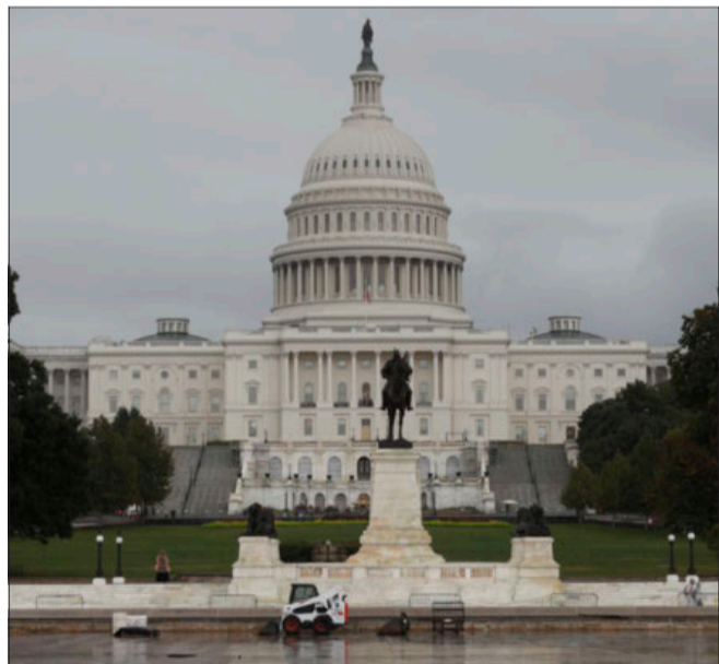
Politikens journalister insisterer på, at dette bygningsværk i Washington indeholder Republikanernes Hus.

– Mette F. vil gerne overvåge danskerne i hoved og røv, mens hun ved at blokere for en ny offentlighedslov effektivt forhindrer vælgerne i at kontrollere regeringen og embedsværket. Det er ret utrygt.