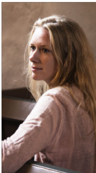
Her ses en flæbende præst, som ingen tager alvorligt.