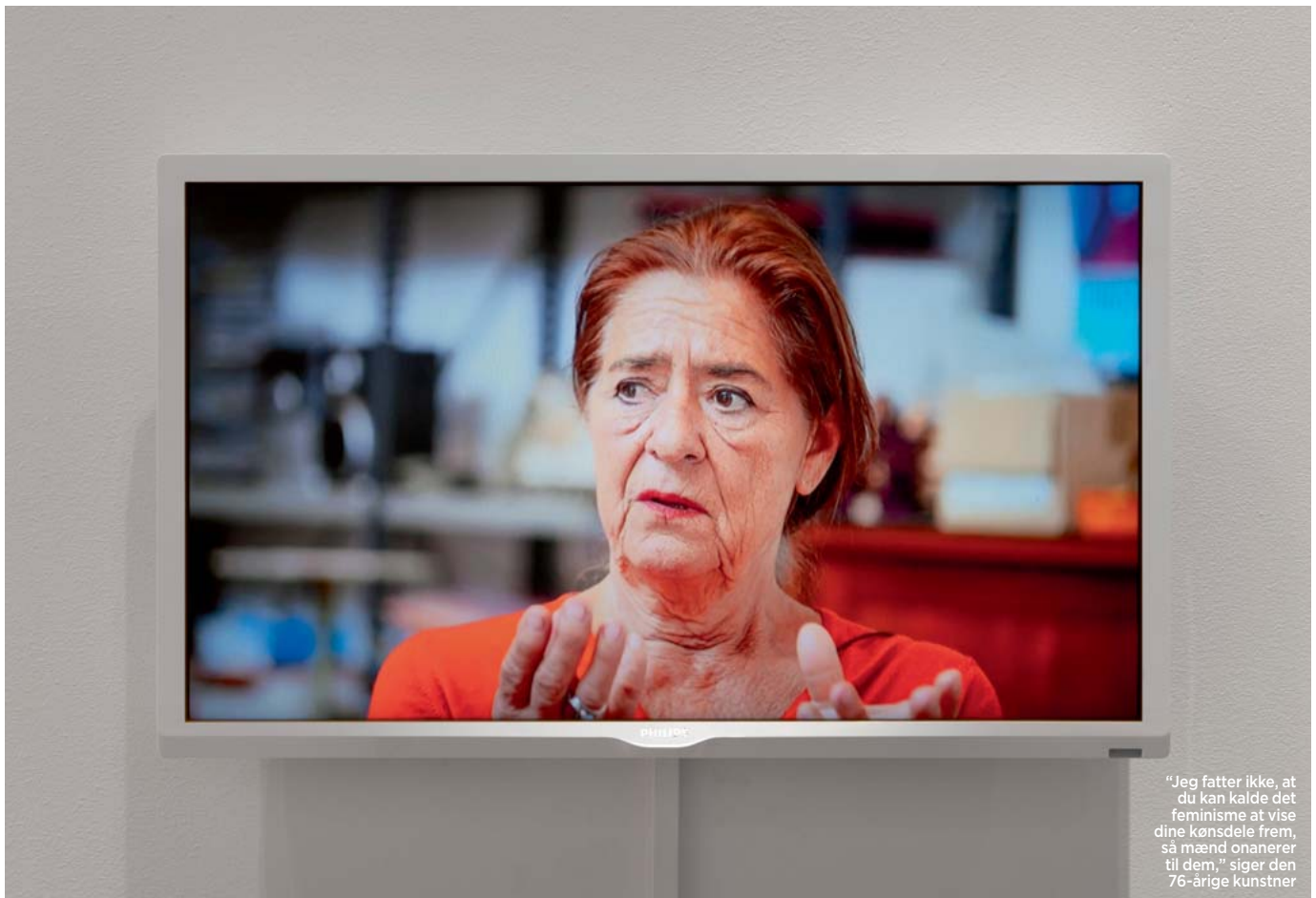
"Jeg fatter ikke, at du kan kalde det feminisme at vise dine kønsdele frem, så mænd onanerer til dem," siger den 76-årige kunstner