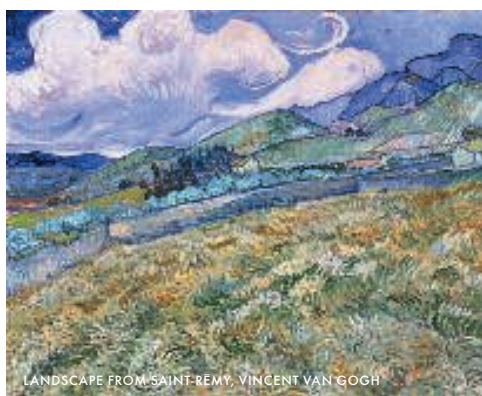
LANDSCAPE FROM SAINT-REMY, VINCENT VAN GOGH