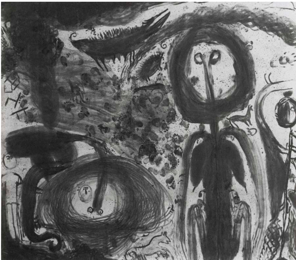
o.t., 25.8.02. Detail.

Miriam Cahn (født 1949 i Basel) bor og arbejder i Stampa i Schweiz. Hun har de sidste par år haft omfattende soloudstillinger på Sifang Art Museum, Nanjing (2020), Haus der Kunst, München (2019), Museo Nacional Centro de Arte Reina Sofía, Madrid (2019), Kunsthaus Bregenz (2019), Museum of Modern Art, Warszawa (2019) og Kunstmuseum Bern (2019). Hun har deltaget i lang række prestigefyldte internationale gruppeudstillinger, senest bl.a. Sydney Biennalen (2018), Documenta 14, Athen og Kassel (2017), São Paulo Museum of Art (2017) og Centre Pompidou, Paris (2016). Hun har en lang række udstillingskataloger bag sig, og i 2019 blev Writing in Rage udgivet, en samling af Miriam Cahns egne tekster redigeret af kunstneren selv.