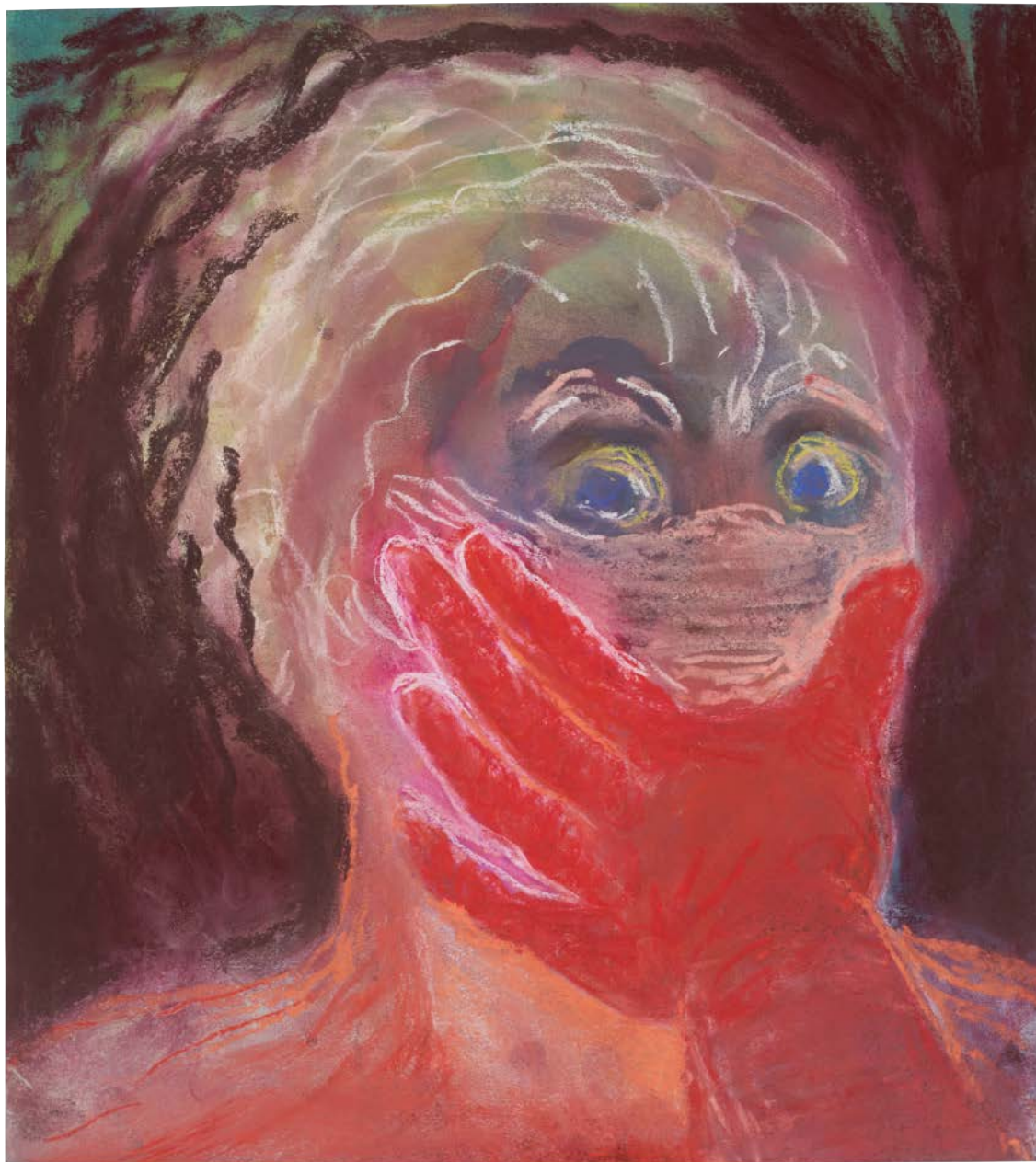
schreck , 12.8.13.

Miriam Cahn ME AS HAPPENING 8 Okt 20 – 21 Feb 21