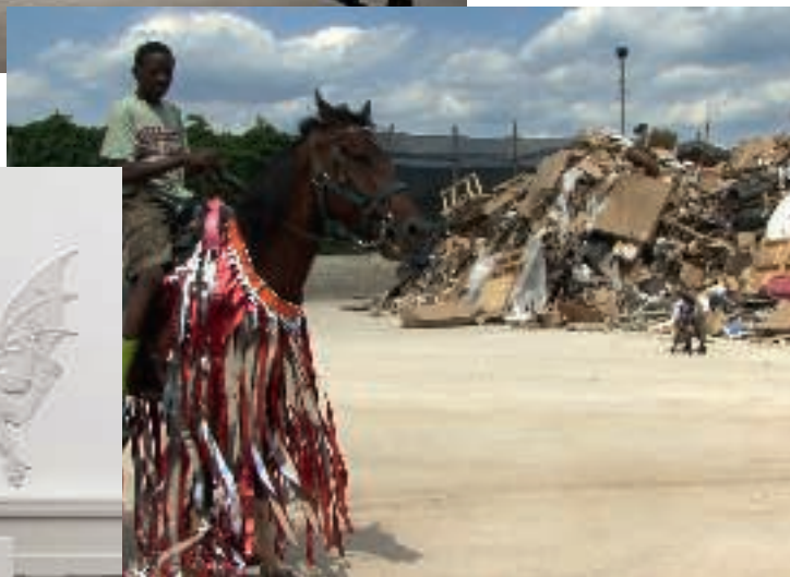
MOHAMED BOUROUISSA, KUNSTHAL CHARLOTTENBURG