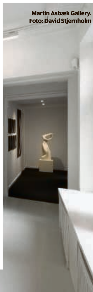
Martin Asbæk Gallery.