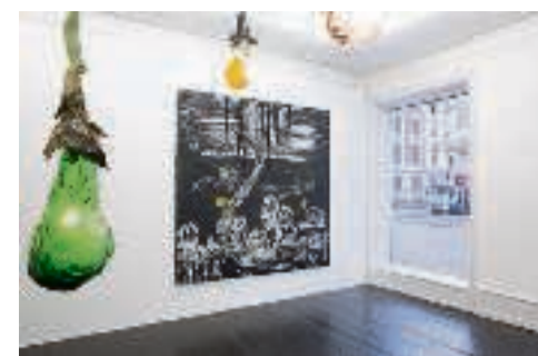
Marie Kirkegaard Gallery.