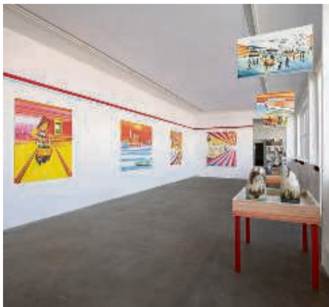
Galleri Bo Bjerggaard.