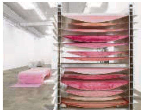
Galleri Nils Stærk.

Husk, at du altid er velkommen på gallerierne OG til en fernisering, uanset om du har 1.000-lapperne flagrende ud ad bukselommerne, eller blot er i byen for at lade dig inspirere og få et lille glas. AOK guider dig frem til ni garvede gallerier fra den bomstærke liga.