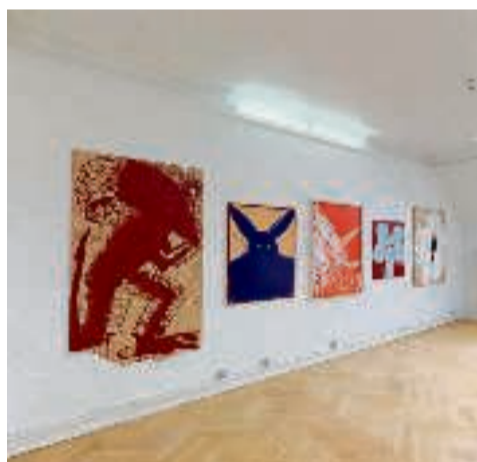
Alice Folker Gallery.