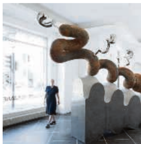
Galleri Susanne Ottesen.