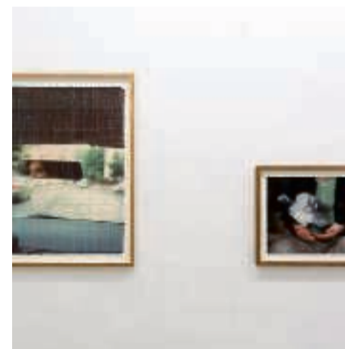
Galleri Kant.