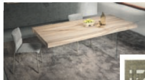
Lago Design, Air XGlass Table m/Onice Matt XGlass top & extra clear glass legs.