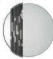
Giorgetti, Rift spejl