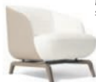
Giorgetti, Janet loungestol

Lago Design har udvidet deres serie af skænke, således der nu er flere attraktive kombinationsmuligheder. Her vist med Onice polished XGlass fronter, Juta lacquer & bronze smoked glass struktur samt Peltro steel legs.