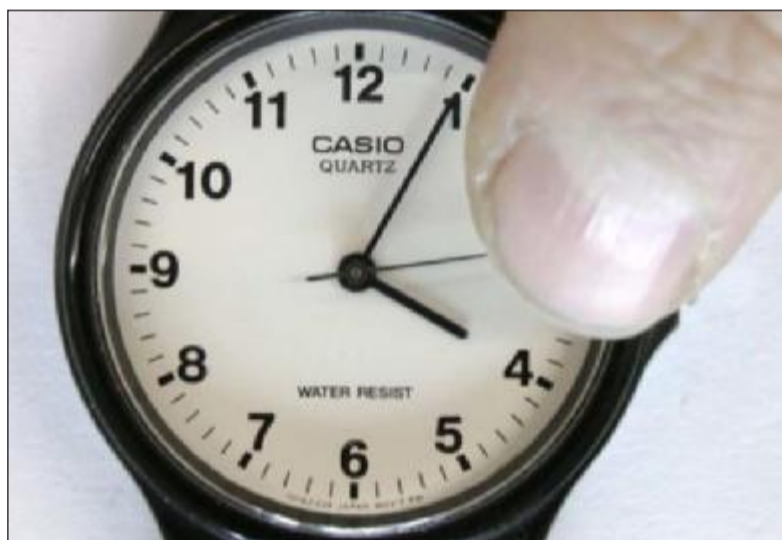
Vores krop følger faktisk naturens døgnrytme. "Self Portrait as Time" af Marcus Coates, 2016.