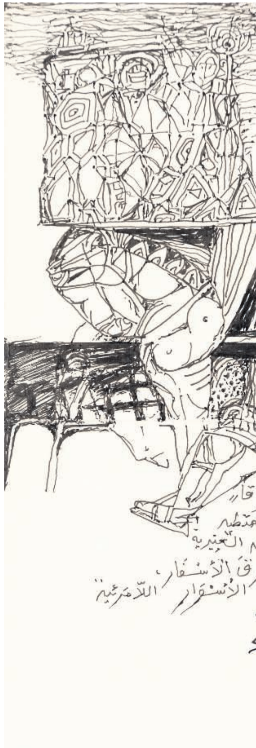
Sudanesiske Ibrahim El-Salahis ikke let afkodelig monument af lige dele søjler, menneskelemmer og arabiske skrifttegn. Man må nyde formerne for deres form og langsomt indse, hvad man ikke forstår.

Værkerne kommer til at virke som ufrivillige medvirkende i et marketingstunt, når de ikke kommer ud på de busstoppesteder og togstationer, de blev lovet til. Reklameindustrien hvidvaskes med fine, men forløjede erklæringer om aktivistisk kunst