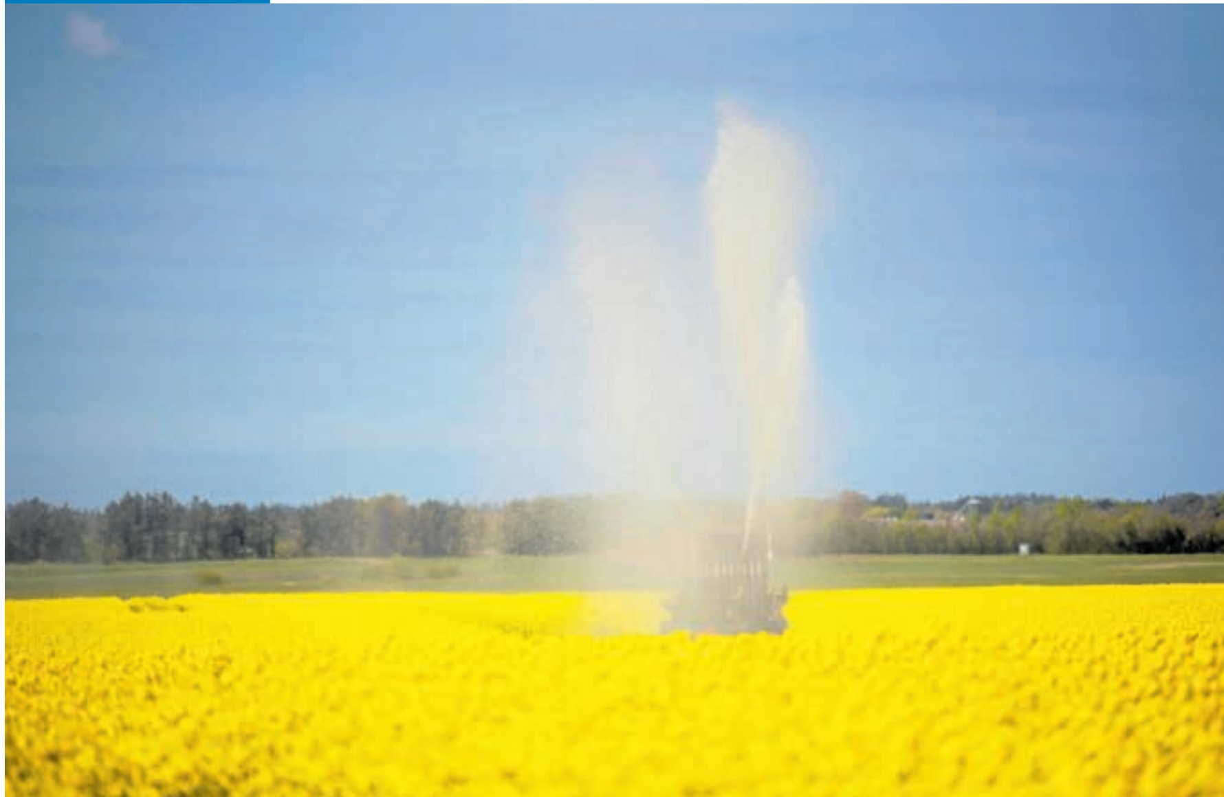
▲ KRIGEN I UKRAINE HAR SOM BEKENDT sat sit præg på verdens fødevareresituation, blandt andet i form af stigende priser. Det ses også i landbruget, hvor prisen på raps i de seneste

uger er steget markant. Afgørende er dog naturligvis høsten, og her har Danmark de seneste mange uger fået så lidt regn, at flere landmænd nu må ty til vanding af markerne.